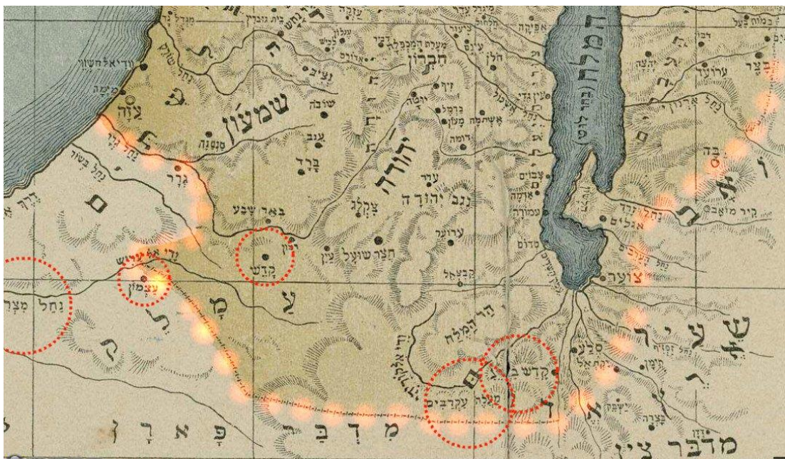
דרום הערבה, לפי ר' יהוסף שורץ, בהוצאת לנדא (1915)