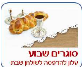
סוגרים שבוע עלן להדפסה לשולחן שבת