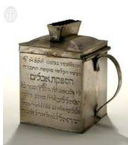
קופת צדקה מגרמניה (1821) עשויה כסף (אוסף משפחת גרוס, תל אביב)

הקופה אינה נגבית בפחות משנים (פאה פ"ח מ"ז; ברייתא ב"ב ח ב; רמב"ם פ"ט ה"ה; טושי"ע רנו ג), שאין עושים שררה על הציבור בממון פחות משנים (ב"ב שם ע"פ שקלים פ"ה מ"ב; רמב"ם שם; טושי"ע שם), שנאמר: וְהֵם יִקְחוּ אֶת הַזֶּהָב (שמות כח ה) - מכאן שאין גובים פחות משנים (ירושלמי שקלים שם; רב נחמן ב"ב שם); וגביית צדקה דבר של שררה היא, לפי שממשכנים על הצדקה (רב נחמן אמר רבה בר אבוה שם).