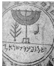
ציור המנורה ברצפת בית הכנסת "שלום על ישראל" ביריחו

הדלקת הנרות. מצות הדלקת שבעת הנרות שבמקדש. הפרקים: א. המצוה ומקורה; ב. זמנה; ג. השמן והפתילות; ד. ההדלקה; ה. המדליק